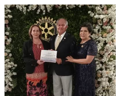
Visita CR San Felipe Guanajuato