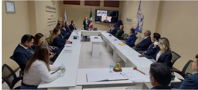
Visita a CR Smart San Miguel de Allende

Agradecemos a todos los clubes por su apoyo y acompañamiento estamos seguros que el trabajo en equipo puede lograr grandes cosas para nuestro distrito.