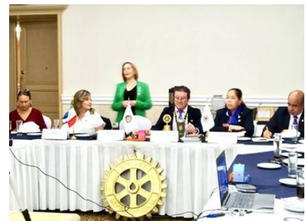
Visita CR Corregidora Querétaro