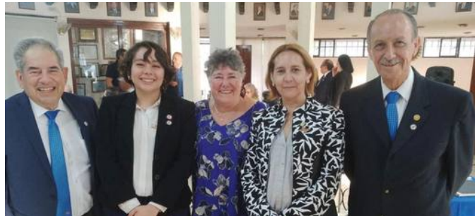
Visita a CR Queretaro

Agradecemos a todos los clubes por su apoyo y acompañamiento estamos seguros que el trabajo en equipo puede lograr grandes cosas para nuestro distrito.