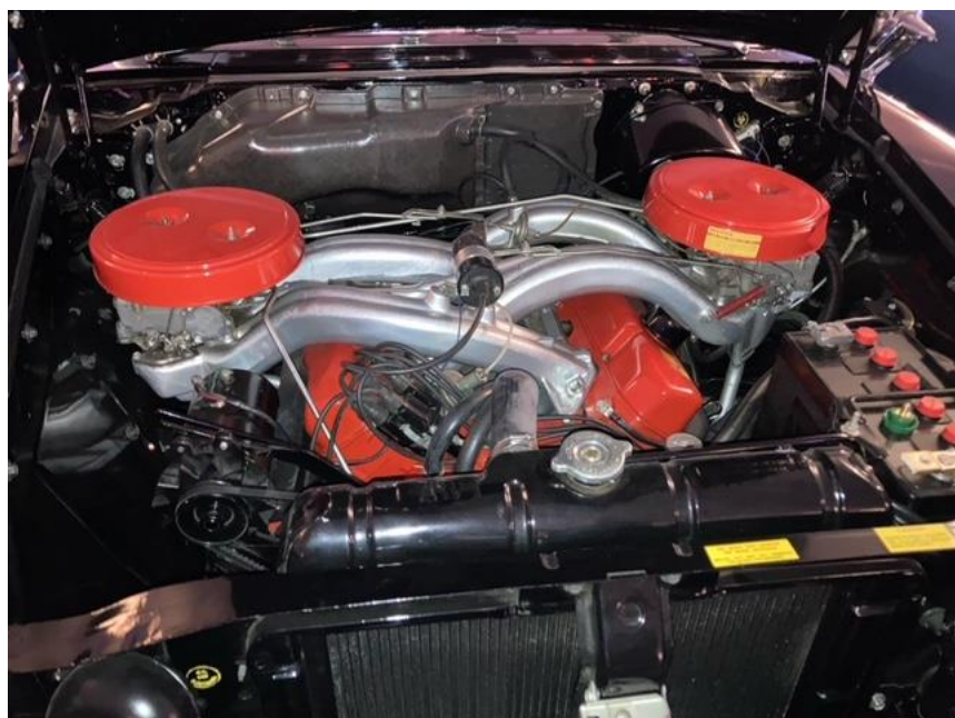
Crossflow insug på en V8a, skulle ge bättre bränslemix och mer Hk