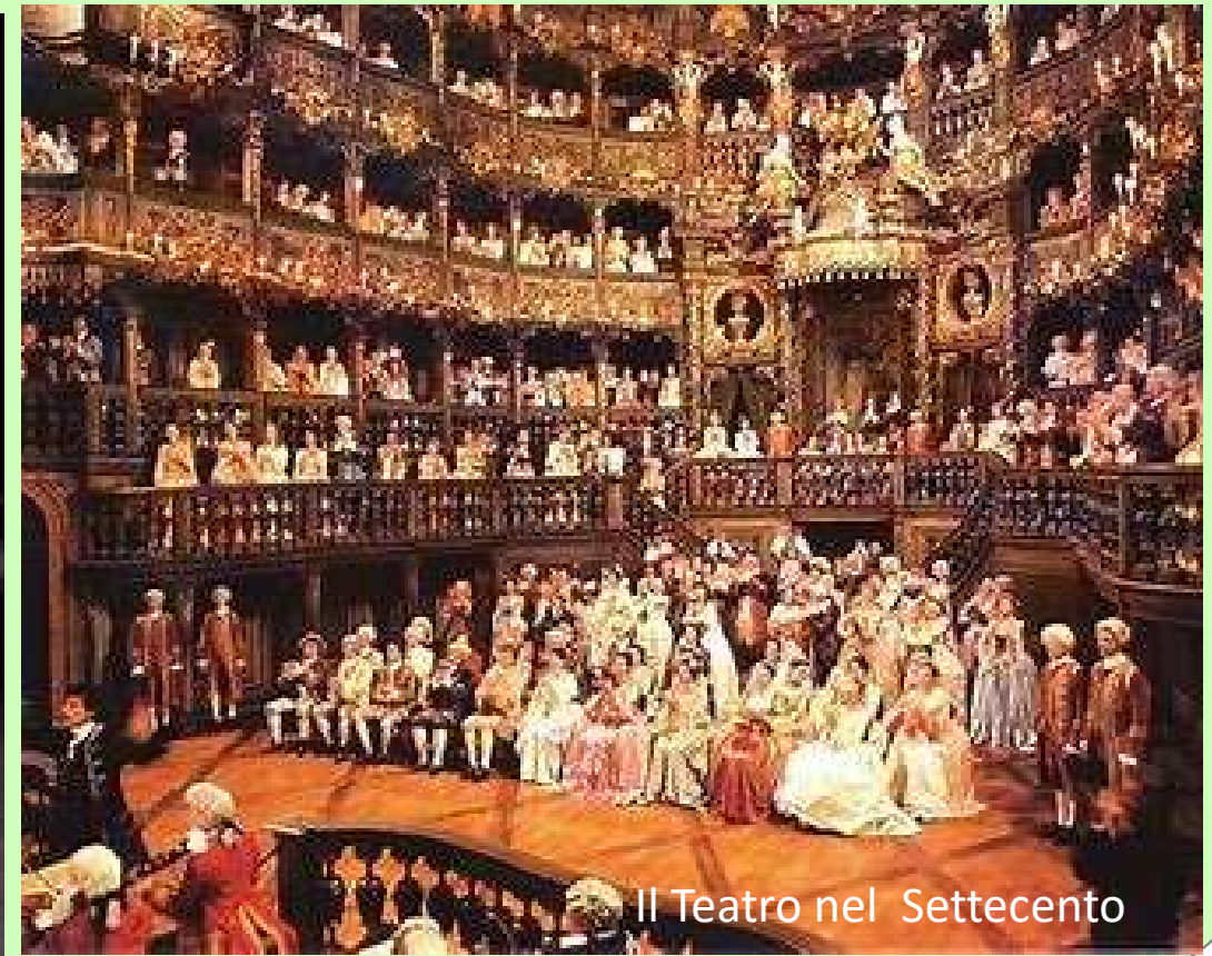
Il Teatro nel Settecento