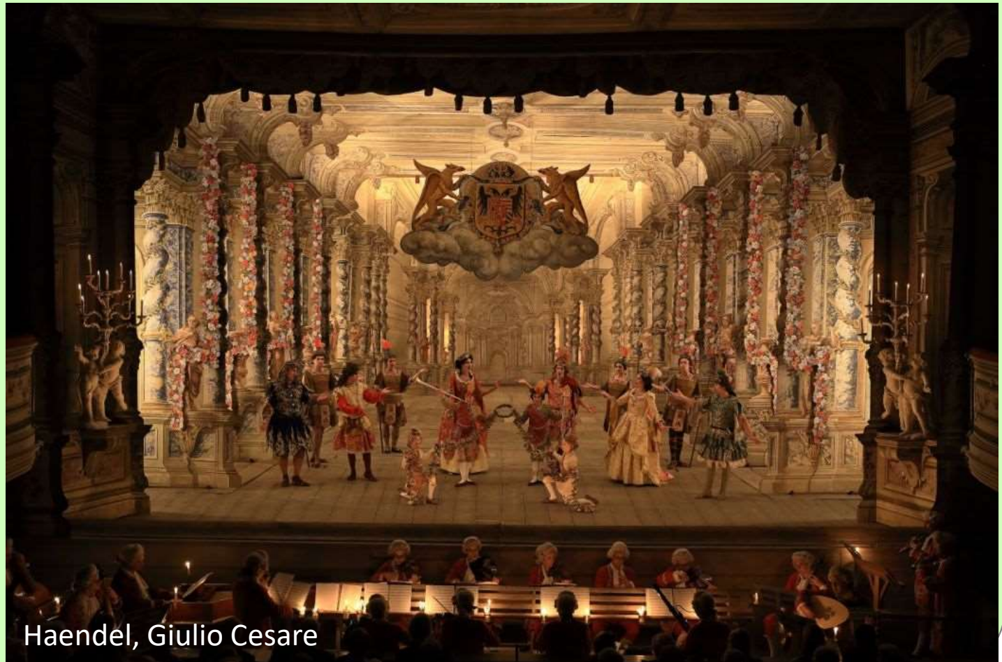
Haendel, Giulio Cesare

Barocco e rococò: l'uso di scenografie opulente e magnifiche aveva lo scopo di riflettere il potere e la divinità, celebrare la mitologia creando un contrasto visivo tra le forze terrestri e quelle sovranaturali.