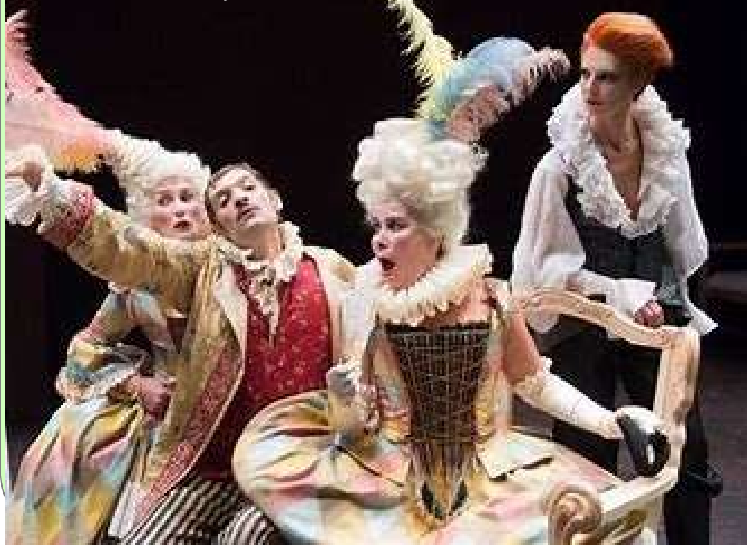
Salieri, L'Europa riconosciuta

Nell'opera settecentesca i costumi si fanno sontuosi e dettagliati , in grado di rappresentare visivamente la grandezza del contesto storico e la nobiltà dei protagonisti. L'uso di tessuti pregiati e di accessori come cappelli , le pettinature elaborate, gioielli e pellicce o, richiama l'idea di potere e status. (es. Salieri, Europa riconosciuta - Mozart, Il Ratto dal Serraglio ).