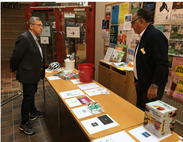
Det har blivit tunt på prisbordet.