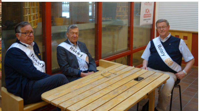
Trötta rotarianer vilar ut efter väl förrättat värv.