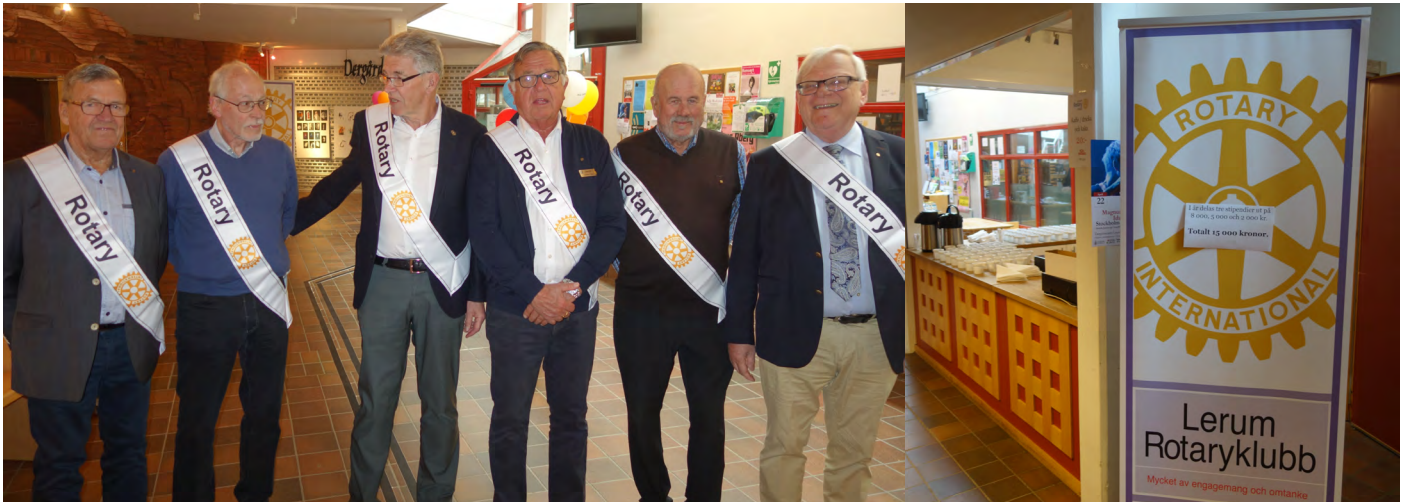
Väl förberedda och välkomnande rotarianer på led!

Totalt 15.000:- fördelade på tre stipendier på 8 000:-, 5 000:- och 2 000:- delades ut.