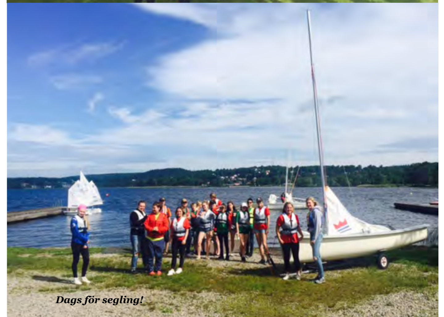
Dags för segling!