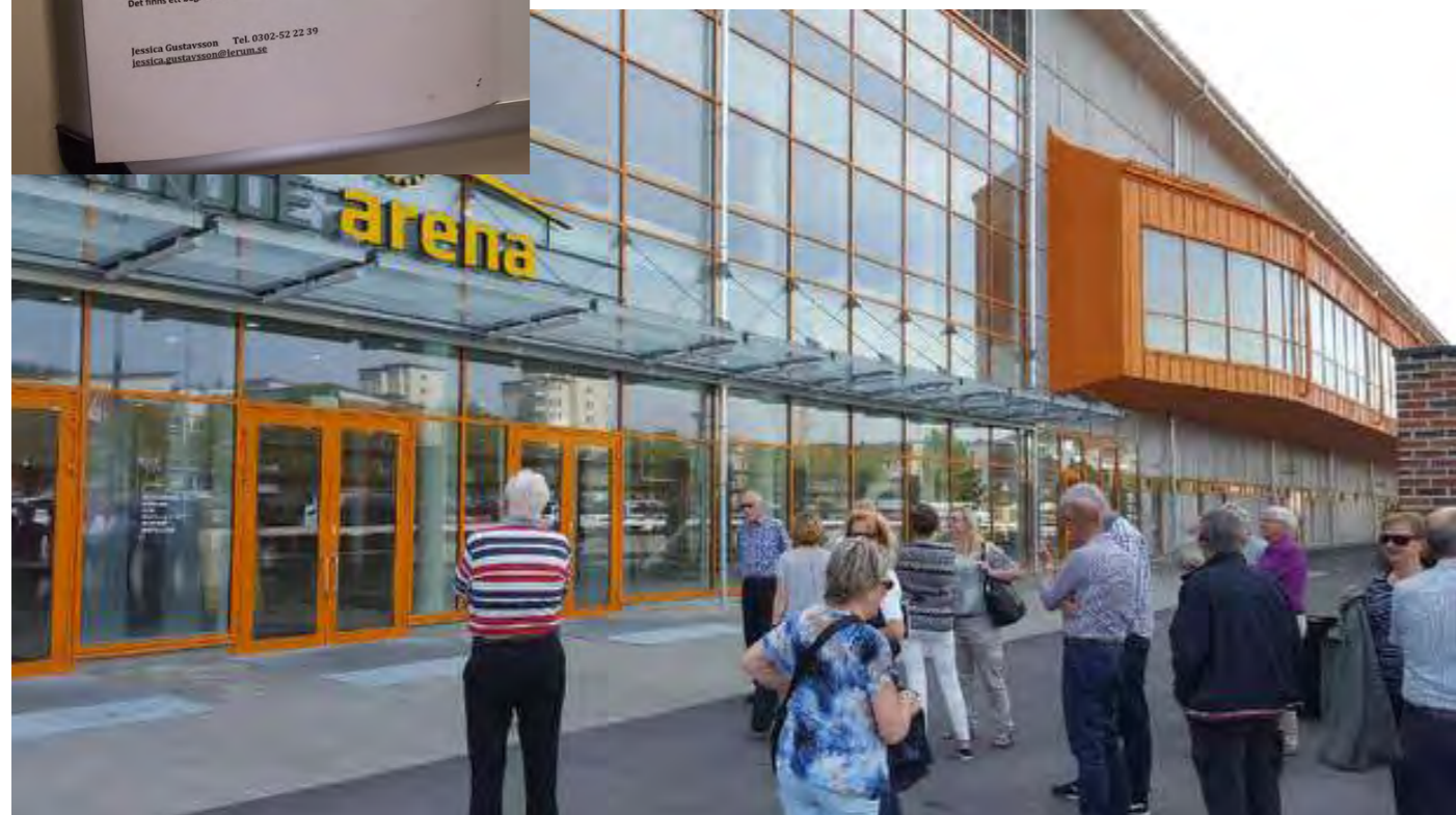
Bild från anslagstavla på äldreboende.

Onsdagen den första juni 2016 arrangerade kommittén för samhällstjänst en utflykt för personer som vårdar anhöriga i hemmet. Resan gick till Öjared och inleddes med en visning av kapellet följt av lunch på golfklubben med efterföljande visning av Öjareds hotell. Ett knappt 20-tal tacksamma deltagare skjutsades av sex rotarybröder.