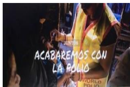
JUNTOS ACABAREMOS CON LA POLIO