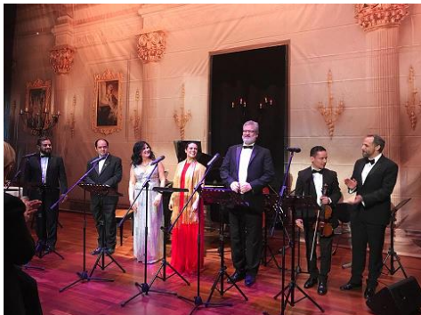
Cena de Gala en el Auditorio de la Universidad Francisco Marroquín

Las presentaciones del oratorio El Mesías se realizaron con gran éxito. Lo más importante es que lo recaudado se transforma en oportunidades a través de proyectos en la cuenca del Lago de Atitlán y en contribución para las becas Mary Sue.