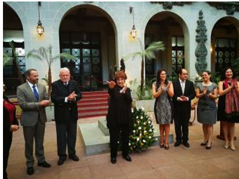
Cambio de la Rosa de la Paz en el Palacio Nacional de la Cultura