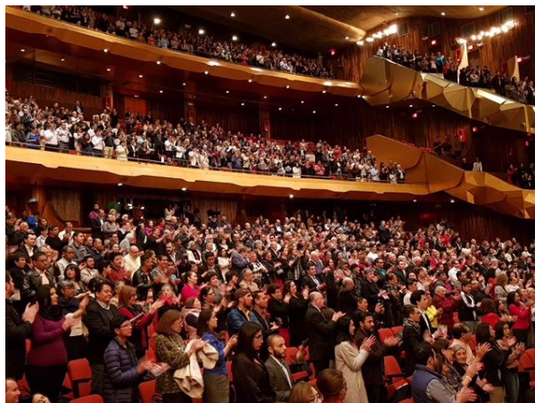
Gran Sala Efraín Recinos del Teatro Nacional