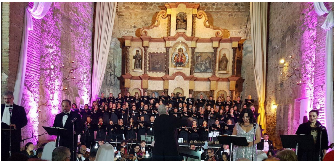
Capilla del Hotel Casa Santo Domingo