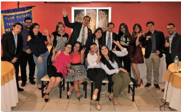
Club Rotaract Metropolitano Tegucigalpa