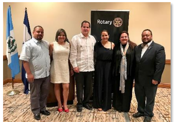
Grupo Asistentes de Gobernador región Centro Sur HN