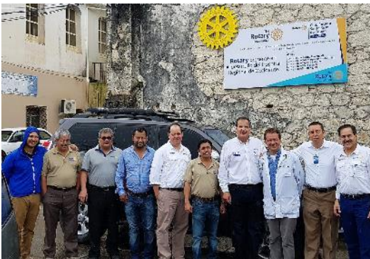
CR Santa Rosa de Copán