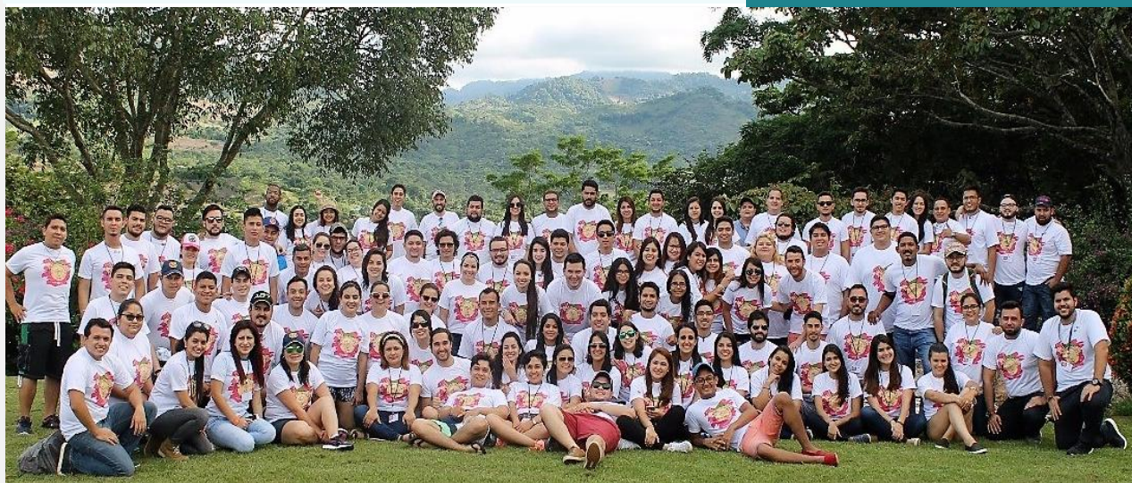
Intercitadina de Rotaract Honduras

«Gracias a la visión de Arch Klumph y a la generosidad de los socios de Rotary, LFR se transformó en una de las principales fundaciones humanitarias del mundo.»