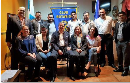
CR Intibucá La Esperanza