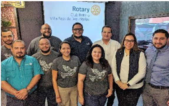
JD CR Villareal de Tegucigalpa